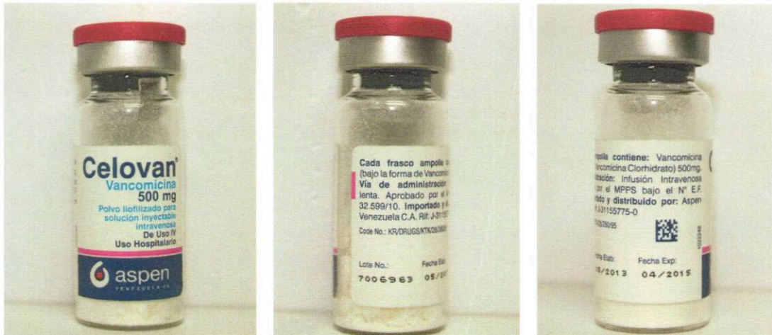
Medicamento con Registro Sanitario

Muestra Falsificada de Celovan 500 mg Polvo para Solución Inyectable, lote: 7630220 y muestra con Registro Sanitario, provenientes del notificador.