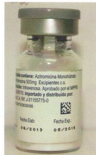
Medicamento con Registro Sanitario