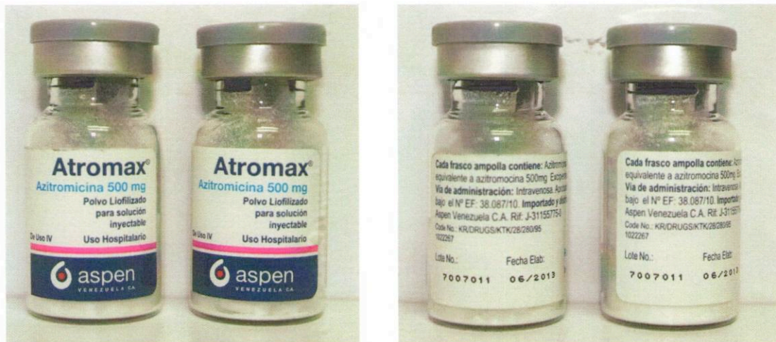
Medicamento con Registro Sanitario. Lote: 7007011. Fecha Elaboración: 06/2013, Fecha de Vencimiento: 05/2015