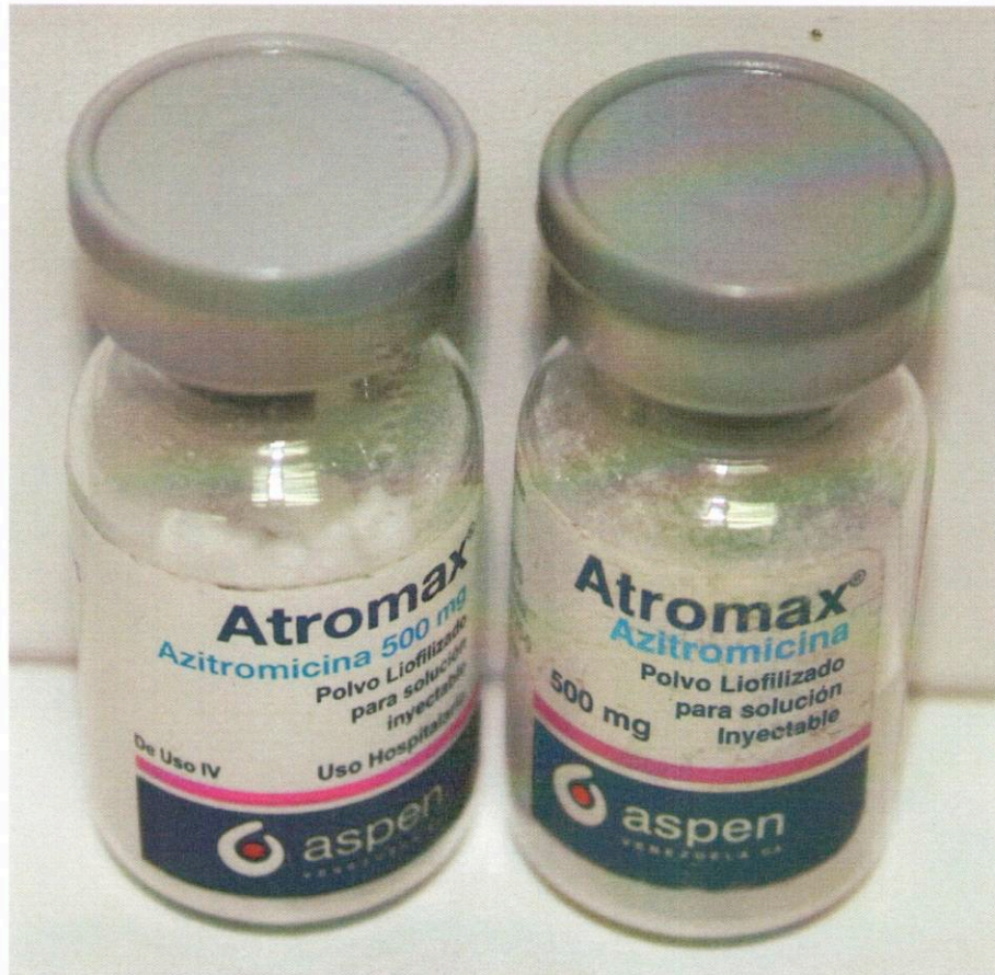
Medicamento con Registro Sanitario

Muestra Falsificada de Atromax 500 mg Polvo para Solución Inyectable, lote: 7601542 y muestra con Registro Sanitario, provenientes del notificador.