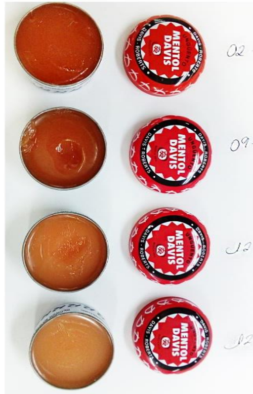
Imágenes del producto falsificado