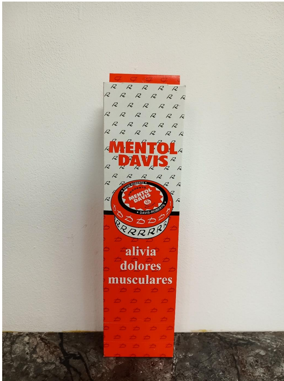
Imágenes de la cara frontal del dispensador del producto falsificado .