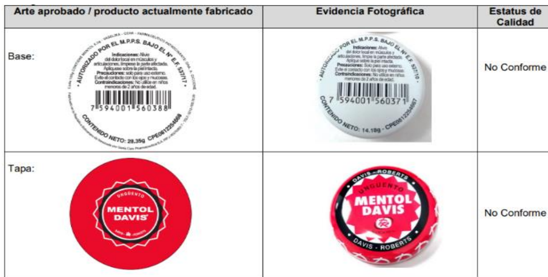
Comparación fotográfica del producto registrado (izquierda) y del producto falsificado (derecha), contenido y envase primario